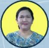
RIDAULI, SH. PENCAKUP ADMINISTRASI UMUM