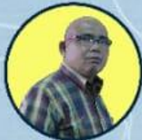
ROSMAN, S.Soc. PENCAKUP ADMINISTRASI UMUM