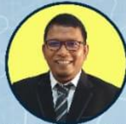
ISWADI HR, ST, MT, Ph.D. KEPALA UPT TIK